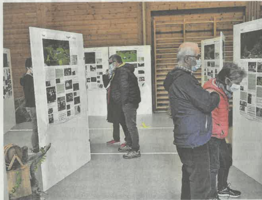
Die zwei Ausstellungen mit den 90 Ausstellungstafeln und erstmaligen Kurzvideos zu jedem «Heimä» vermittelten einen Einblick in die Kulturgeschichte eines Bergtals.

Die langjährige Sammlungs- und Ausstellungstätigkeit der Kulturkommission stösst bei der einhei-